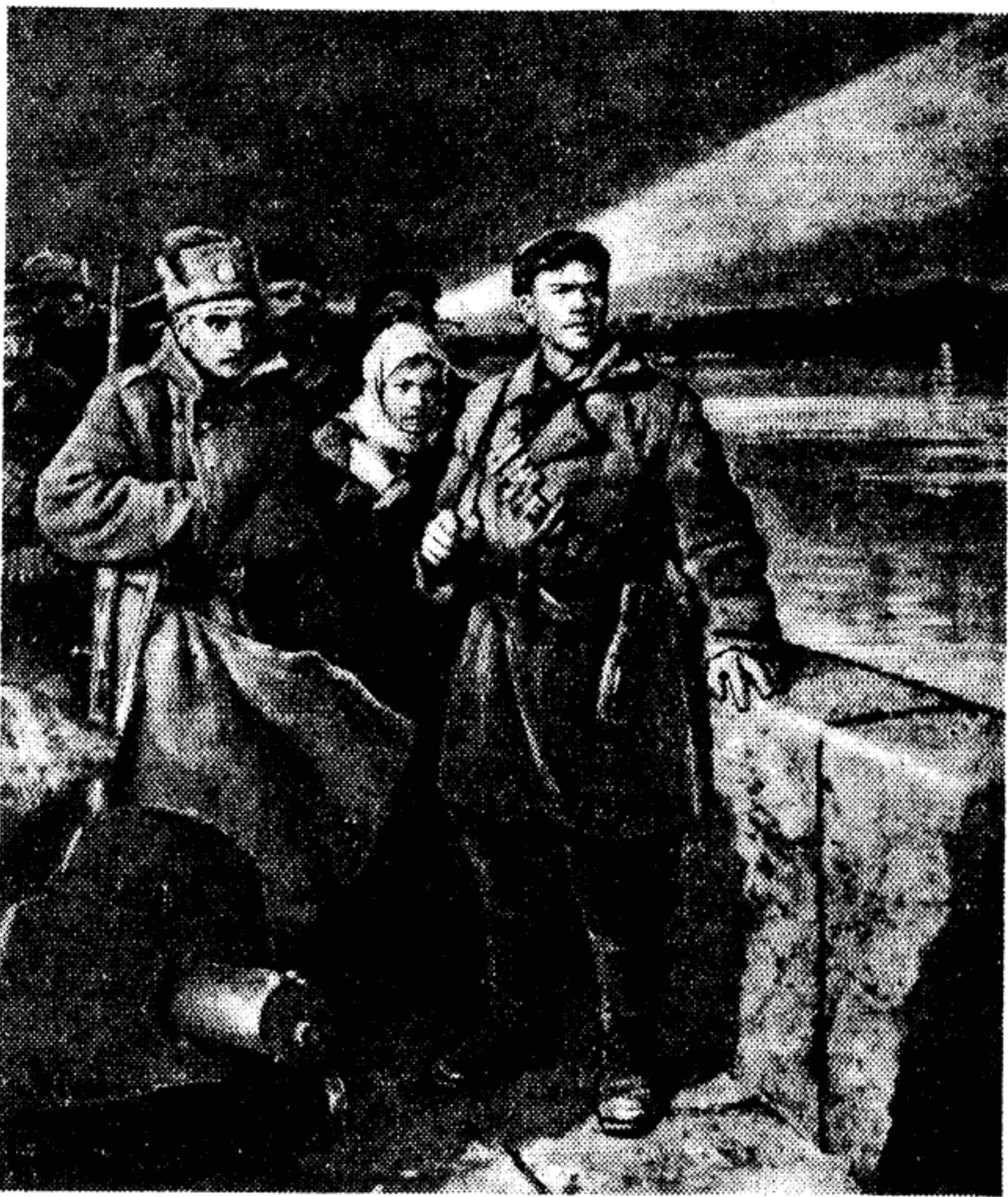
Ждут сигнала. Перед штурмом. Картина художника В. Серова