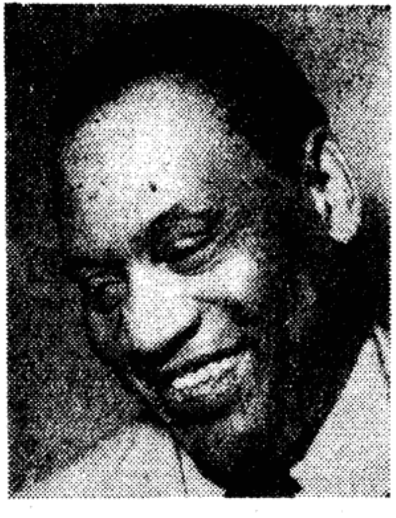
Ниже мы публикуем статью Поля Робсона, написанную им для «Литературной газеты».

ПОЛЬ РОБСОН — выдающийся певец и актер, видный американский прогрессивный общественный и политический деятель. В 1921 году началась артистическая карьера Поля Робсона. Его можно назвать певцом-публицистом. Он выступает с песнями, зовущими на борьбу за мир, пропагандирует произведения советских композиторов, негритянские народные песни. С 1950 года Поля Робсон — член Всемирного Совета Мира. За неустанную и плодотворную деятельность на поприще борьбы за мир ему была присуждена Международная премия мира и Международная Ленинская премия «За укрепление мира между народами».